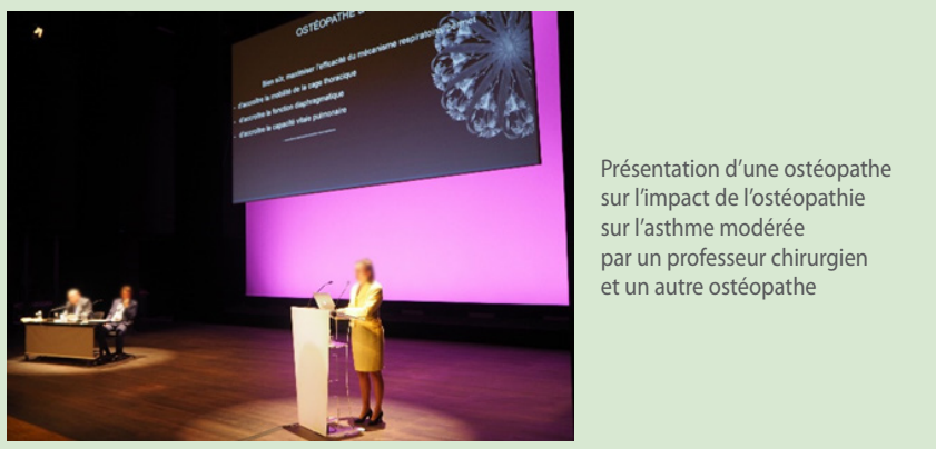
Figure 2. Disposition d'une session lors de la conférence annoncée Photo volontairement floutée

vées plus largement dans l'ensemble de notre ethnographie. Les approches thérapeutiques mentionnées ci-dessus sont enseignées dans les facultés de médecine sous la forme de « diplômes universitaires » (DU), de « capacité » (pour l'acupuncture) ou de « diplômes d'enseignements spécialisés complémentaires » (DESC). Chacun de ces titres témoigne d'une compétence supplémentaire, mais ils sont périphériques dans la hiérarchie des études médicales. Si les certifications universitaires peuvent donner une certaine légitimité aux pratiques de ces médecins, ces savoirs demeurent cependant à la marge des facultés et sont toujours sujets à controverses dans le monde médico-scientifique 153 . Ainsi, dans le champ médical, les enseignements spécialisés ou complémentaires participent à la diversité des compétences et des approches des professionnels, et contribuent à rendre perméables les frontières entre pratiques officielles et pratiques marginales.