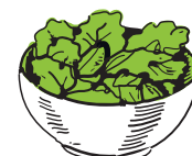
1 bol de salade

48. A quelle fréquence consommez-vous des légumes ou de la salade (en excluant les jus et les pommes de terre) ?