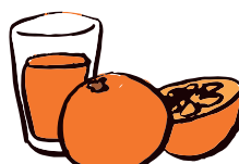
1 jus de fruits fait maison