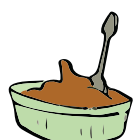
1 compote de fruits